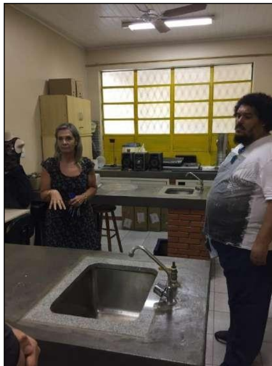
Figura 7 Laboratório de ciências do CE Rodrigues Alves

Todas as escolas apresentavam biblioteca, apesar de duas terem respondido ao Censo Escolar que não as possuíam. Embora as bibliotecas visitadas possuam boas condições de uso, a maioria permanece fechada em função da falta de profissionais.