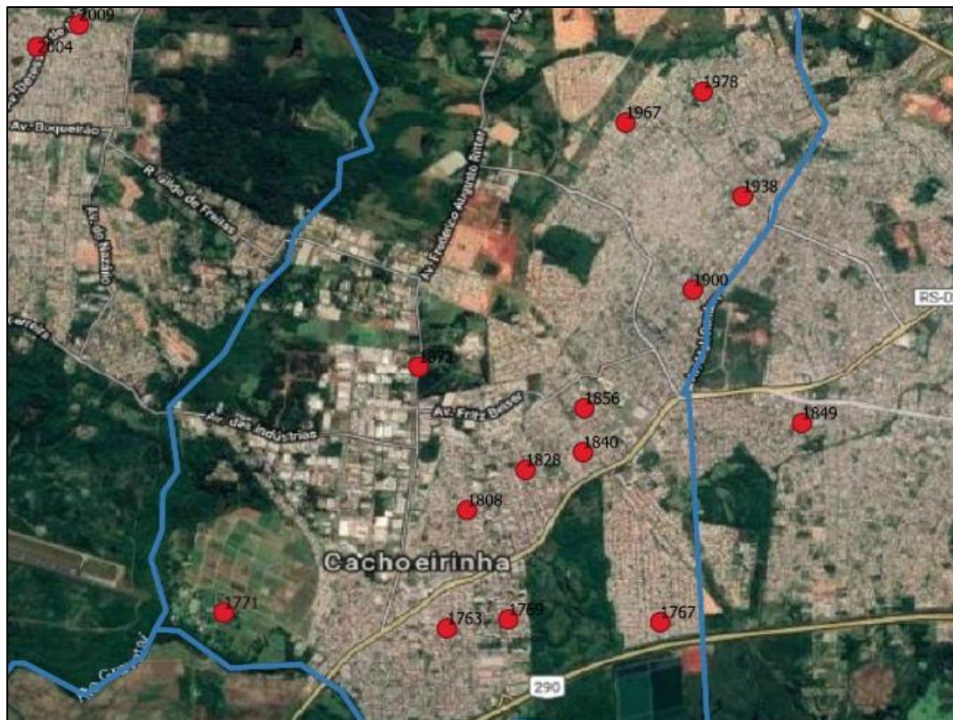
Localização das escolas estaduais de Cachoeirinha